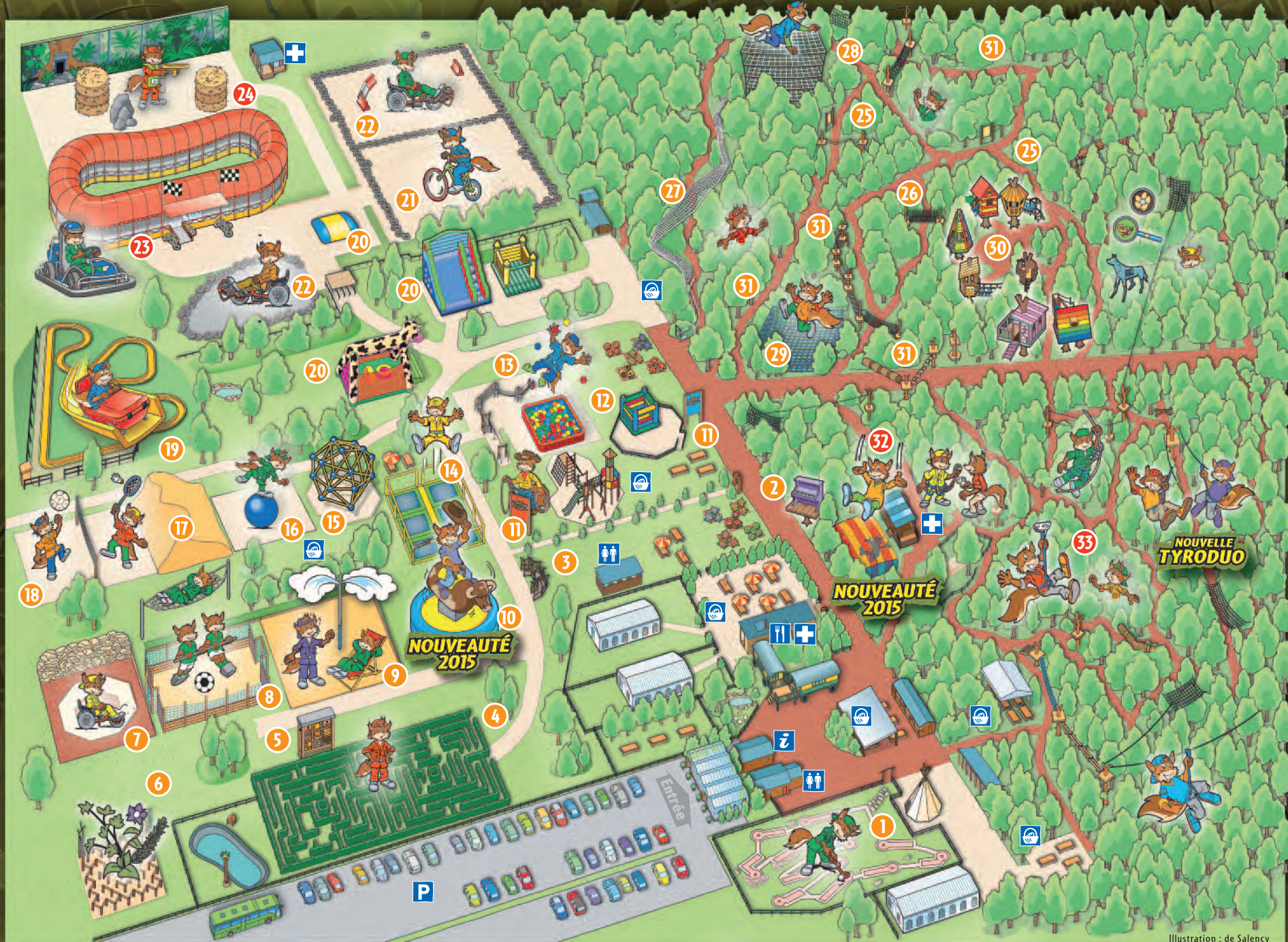
Illustration : de Salency